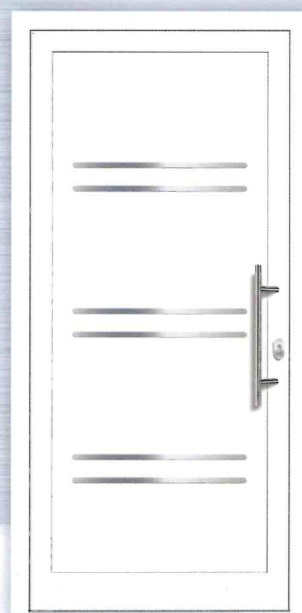
PREZO Basic 12 Aluminium-Füllung Applikationen Edelstahloptik (Alu-Nox) beidseitig Art.Nr.: 217.275 / 7569