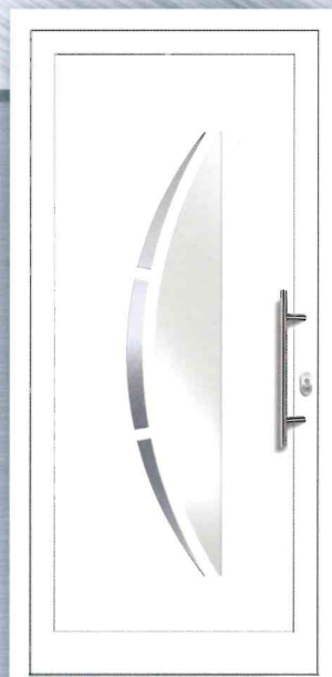
PREZO Basic 11 Aluminium-Füllung Applikationen Edelstahloptik (Alu-Nox) beidseitig VSG-Glas matt weiß foliert (ähnlich Satinato) - Ug 1,1 Art.Nr.: 217.275 / 7568