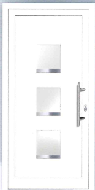
PREZO Basic 09 Aluminium-Füllung Applikationen Edelstahloptik (Alu-Nox) beidseitig VSG-Glas matt weiß foliert (ähnlich Satinato) - Ug 1,1 Art.Nr.: 217.275 / 7566