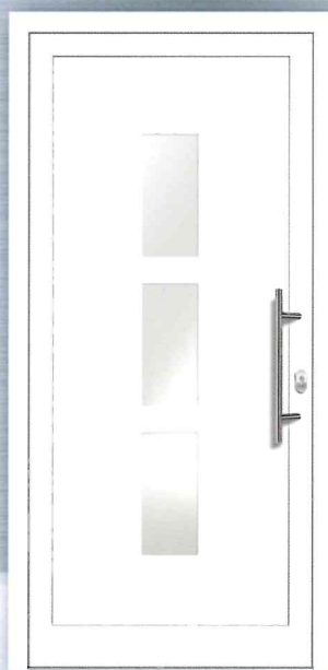
PREZO Basic 03 Aluminium-Füllung VSG-Glas matt weiß foliert (ähnlich Satinato) - Ug 1,1 Art.Nr.: 217.272 / 3234