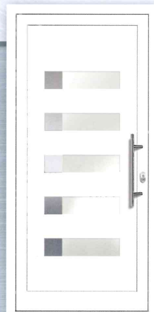
PREZO Basic 10 Aluminium-Füllung Applikationen Edelstahloptik (Alu-Nox) beidseitig VSG-Glas matt weiß foliert (ähnlich Satinato) - Ug 1,1 Art.Nr.: 217.275 / 7567