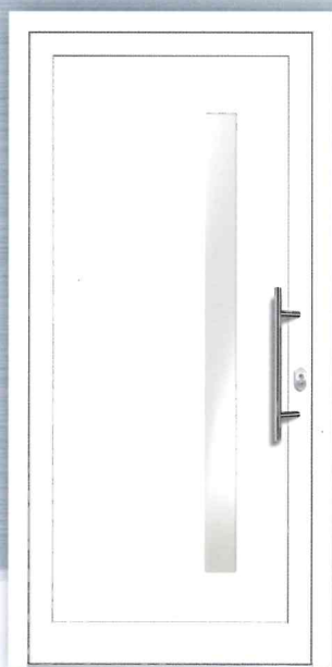
PREZO Basic 01 Aluminium-Füllung VSG-Glas matt weiß foliert (ähnlich Satinato) - Ug 1,1 Art.Nr.: 217.272 / 3232